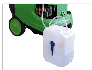
INJECTEUR VENTURI + CRÉPINE : ASPIRATION DÉTERGENT DEPUIS BIDON EXTERNE