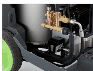
POMPE AXIALE / CULASSE LAITON X 3 PISTONS INOX