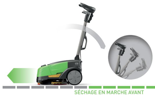
SÉCHAGE EN MARCHÉ AVANT