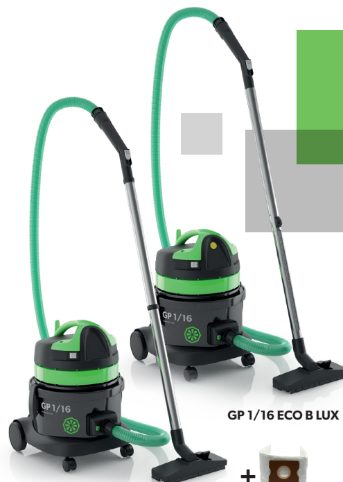
GP 1/16 ECO B LUX