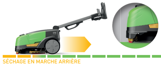
SÉCHAGE EN MARCHÉ ARRIÈRE