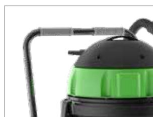
CHARIOT AVEC POIGNÉE