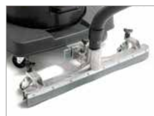
SUCEUR FIXE EN OPTION