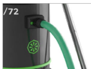
LE FLEXIBLE EST BLOQUÉ DE MANIÈRE SÛRE ET FIABLE