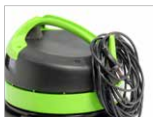
CROCHET POUR CÂBLE