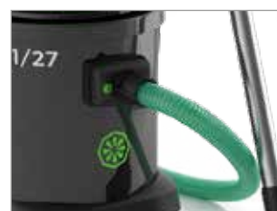
LE FLEXIBLE EST BLOQUÉ DE MANIÈRE SÛRE ET FIABLE