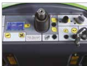
PANNEAU DE COMMANDES