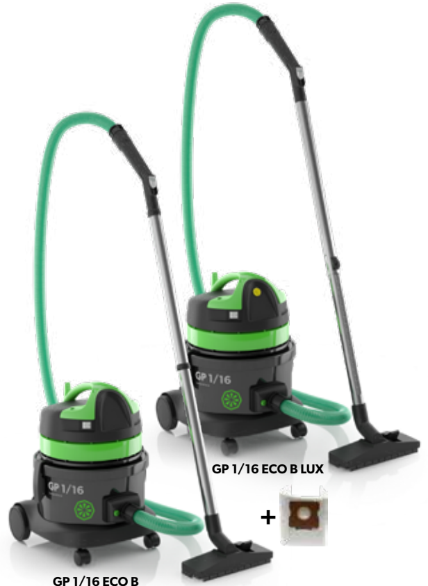
GP 1/16 ECO B